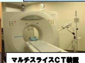
マルチスライスCT装置